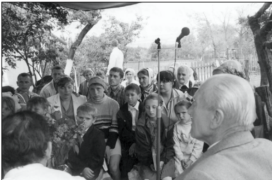
Пасхальное богослужение в Демидовской группе Березовского района Одесской области. 2002 г.

«Кто из вас имеет спасение?» – задал я следующий вопрос. В ответ – молчание. Мы провели с ними разъяснительные беседы, дети открывали все, что было у них в сердце. Я удивлялся и благодати Божьей и тому, что в таком возрасте у детей было в чем серьезно каяться и исповедоваться перед Богом. Мы наставили их прислушиваться к голосу совести и хранить в чистоте сердце. «Христос теперь живет в моем сердце! Я спасен и имею жизнь вечную», – радовались покаявшиеся дети.