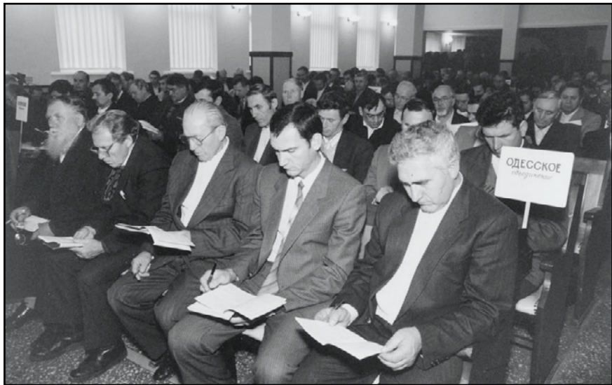
(фото справа, 3-й справа) и в 2001 г. (фото слева, в 1-м ряду 2-й слева).

Придя в сияющую вечность, мы будем сожалеть, что мало страдали за Христа. Поэтому будем стремиться жить так, чтобы удостоиться великой милости не только веровать во Христа, но и страдать за Него (Фил. 1, 29).