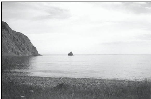
Вид на Охотское море из поселка Аян.

– 45 минут вам на беседу! – неожиданно расщедрился на-