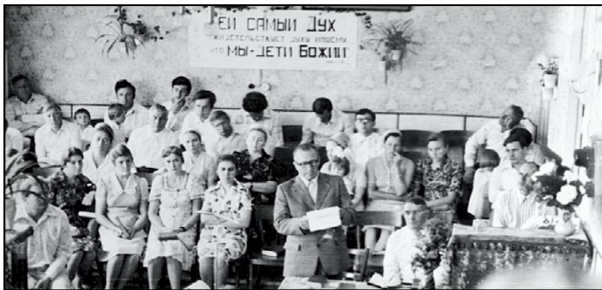
Как мало было таких отрадных минут общения с церковью у дорогого служителя Божьего! (Одесса)

– И на втором котле я не могу дать нужной температуры, – сказал я ответственному кочегару.