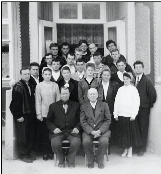
Семинар регентов Одесского объединения. (с. Казацкое, 1999 г.)

Возвратившись домой, я продолжал начатое служение благо-вестия. Небольшой группой мы выезжали в глухие села. Прове-