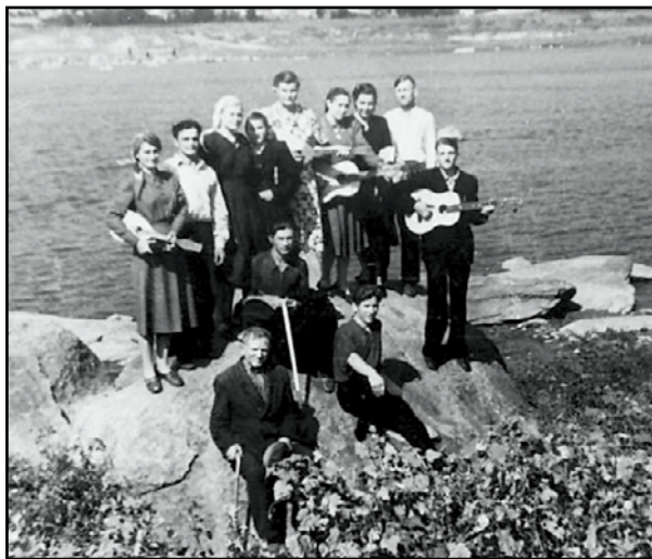
Молодые христиане Вознесенской церкви после благовестия в селах Николаевской области.

да, с какой они слушали проповеди и духовное пение от таких же, как они, молодых людей, была очевидной.