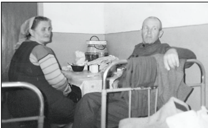
Единственное личное свидание за пять лет неволи.

В пятницу папа совершил вечерю Господню. Мама вручила ему Библию! Он прижал её к груди, обрадовался и сразу стал читать. Потом расспрашивал о церкви – всех он помнил, обо