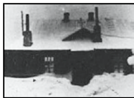
Дома верующих, где проходили богослужения Воркутинской церкви.